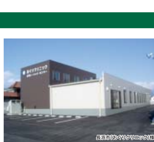
長浜市(おどりクリック)棟