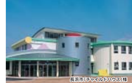
長浜市(チャイルドハウス)棟