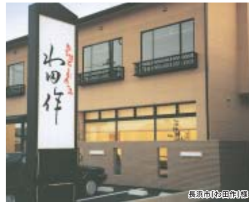
長浜市(松田別荘)棟