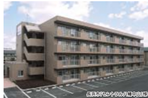
長浜市(セントラル八幡中山)棟