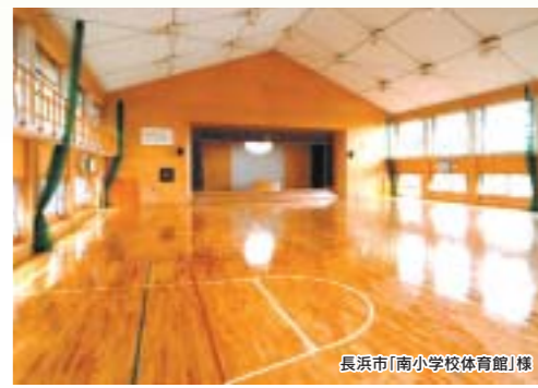
長浜市(南小学校体育館)棟