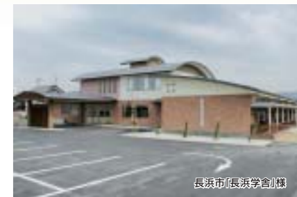
長浜市(長濱学園)棟