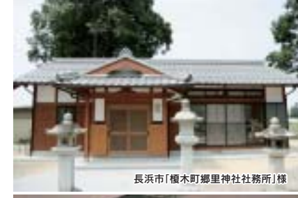
長浜市(榎木町郷里神社事務所)棟