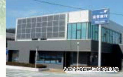
米原市(滋賀銀行山本支店)棟