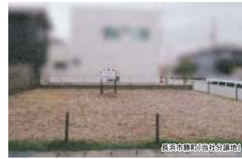
長浜市(馬場分譲地)