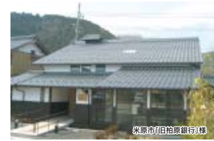
米原市(旧柏原銀行)棟